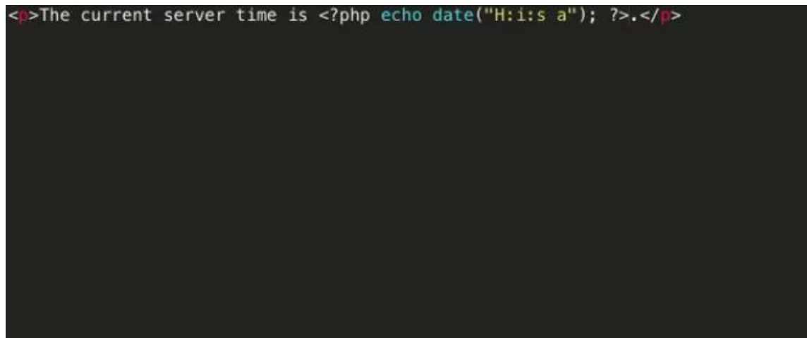
Figure 1 Παρατηρούμε ότι ανοίγουμε ένα tag php και γράφουμε PHP μέσα σε ένα αρχείο HTML

Αντίθετα, εάν χρησιμοποιούσαμε PHP κώδικα στη σελίδα μας, θα καλούσαμε μία συνάρτηση η οποία θα εμφάνιζε την ώρα όπου θα έτρεχε ο κώδικας κάθε φορά: